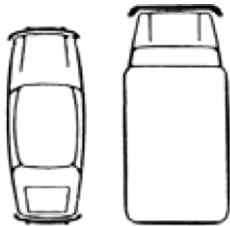
Gráfico del accidente en el momento del golpe

Indique los daños visibles en el vehículo Leasys